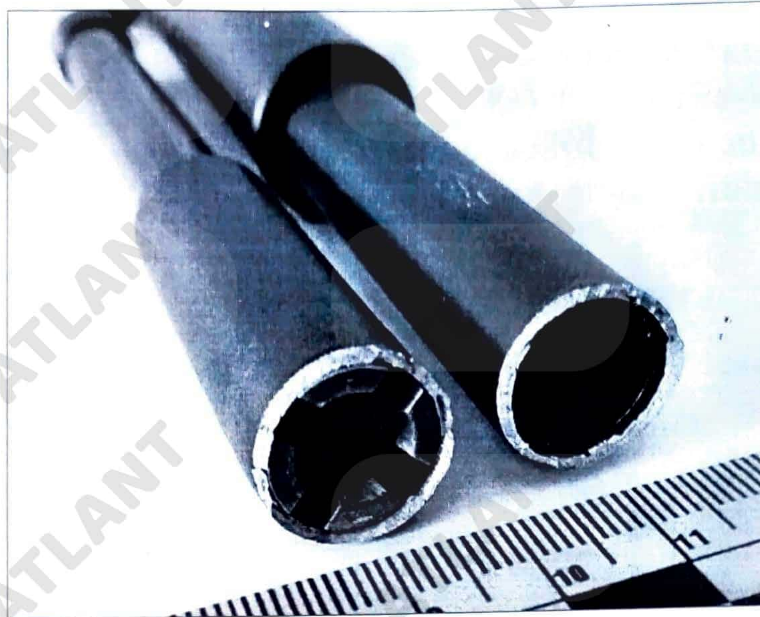
Зображення 6. Вузол розлому середньої секції (діаметром – 16 мм).