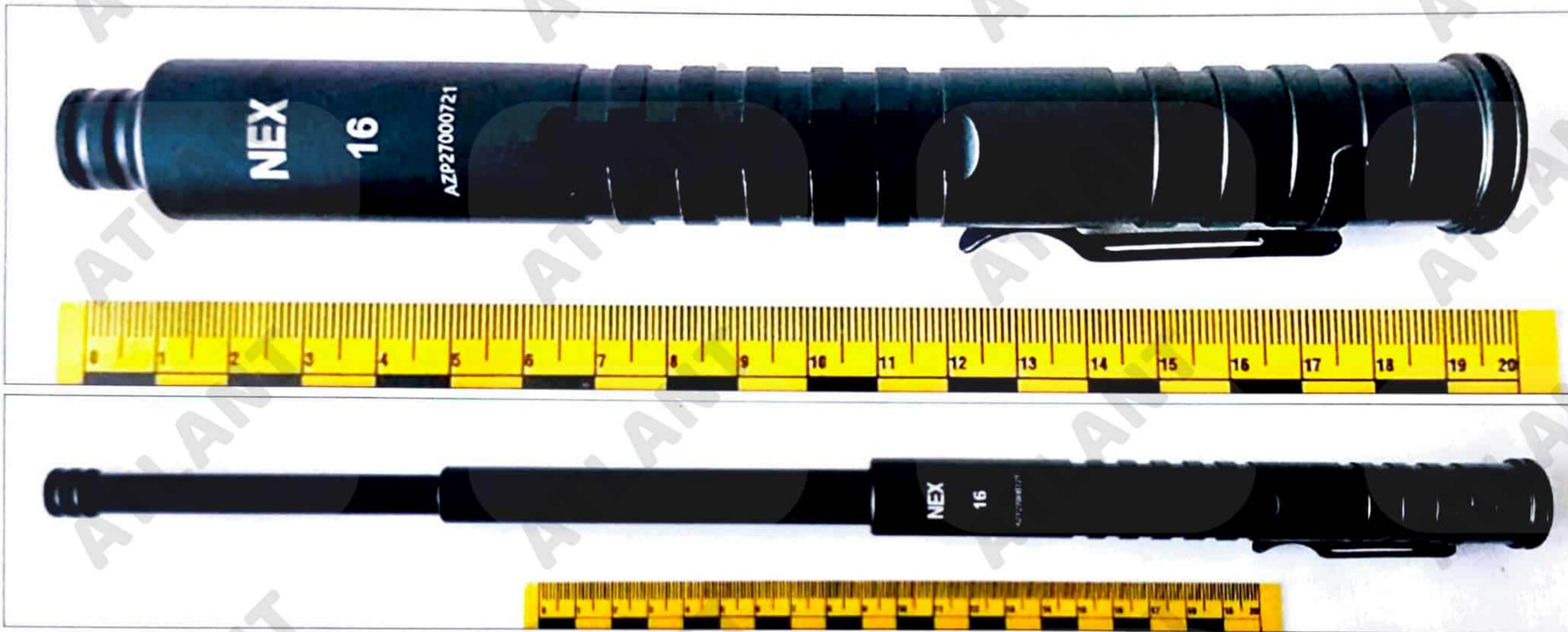
Зображення 1,2. Витягнутий з пакунку об'єкт у складеному та розкладеному стані.

Наданий на дослідження металевий предмет складається з трьох складових (телескопічних) елементів та механізму фіксації (див. зображення 1,2).