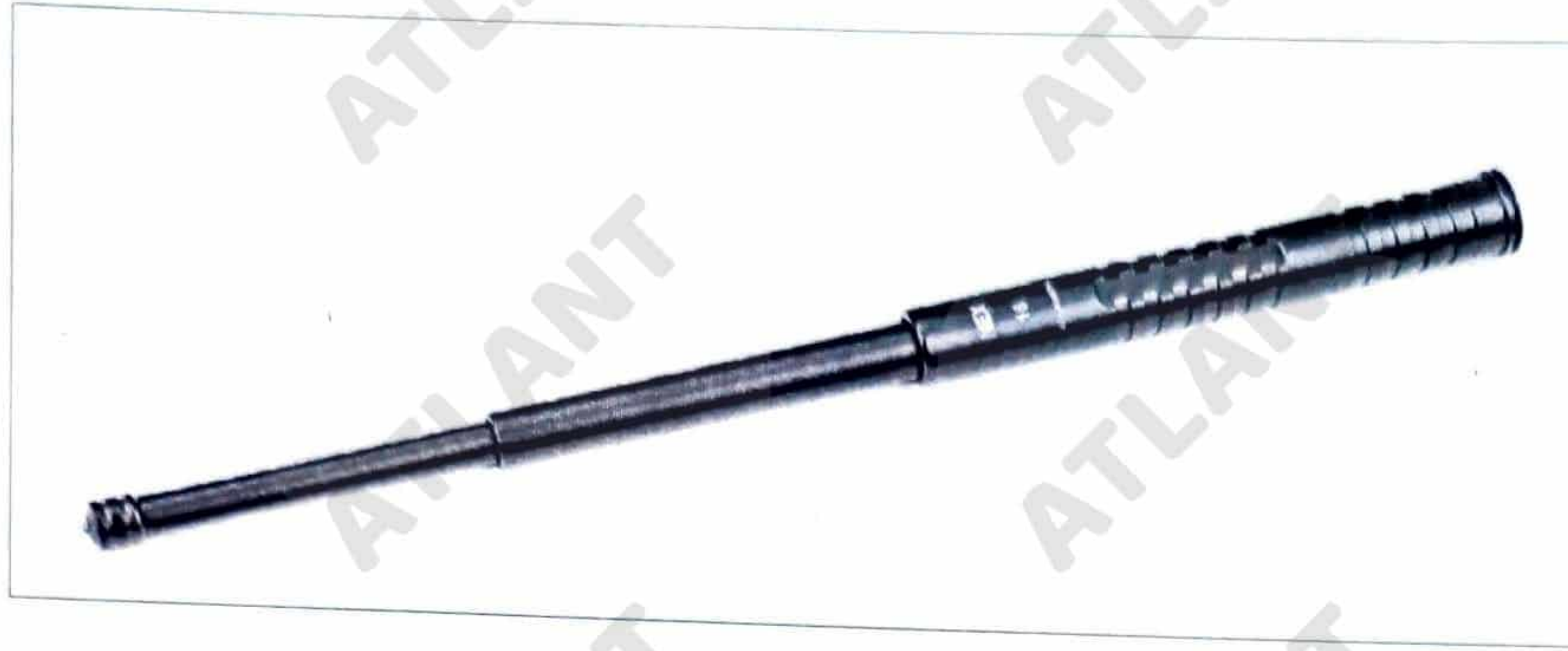
Зображення 4. Інтернет-джерело порівняльного зразку.

бренду «NexTool» моделі «Walker №16» виробництва КНР, що відносяться до індивідуальних пристроїв самозахисту (див. зображення 4).