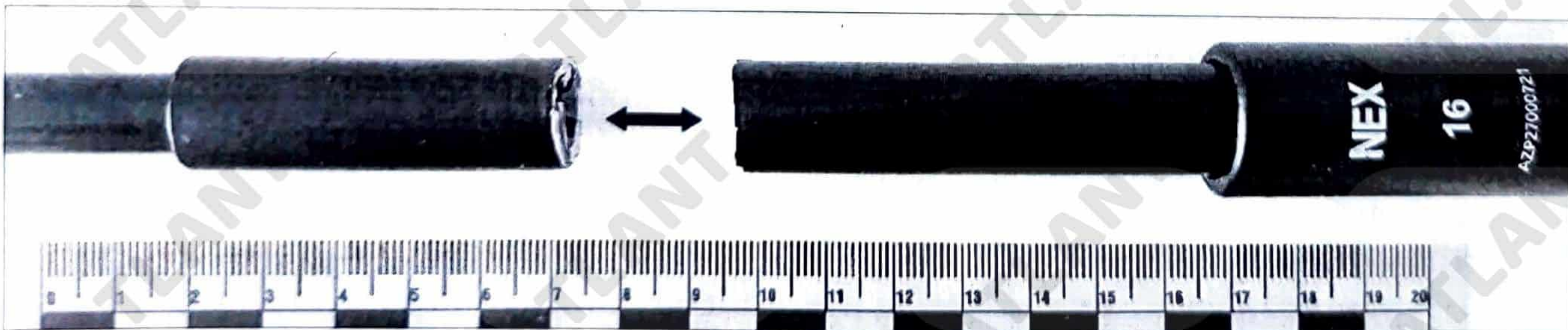
Зображення 5. Остаточна деформація після експертних експериментів.

2) Досліджуваним предметом завдалися удари в суху соснову дошку товщиною до 50 мм з максимальною величиною замаху та максимальним мускульним зусиллям. Під час нанесення 5-го удару у середній секції виник розлом навпіл (в конструктивно найслабкішому місті – внутрішній виточці під фіксуючі елементи цанги), що свідчить про недостатню міцність всієї конструкції в цілому (див. зображення 5,6).